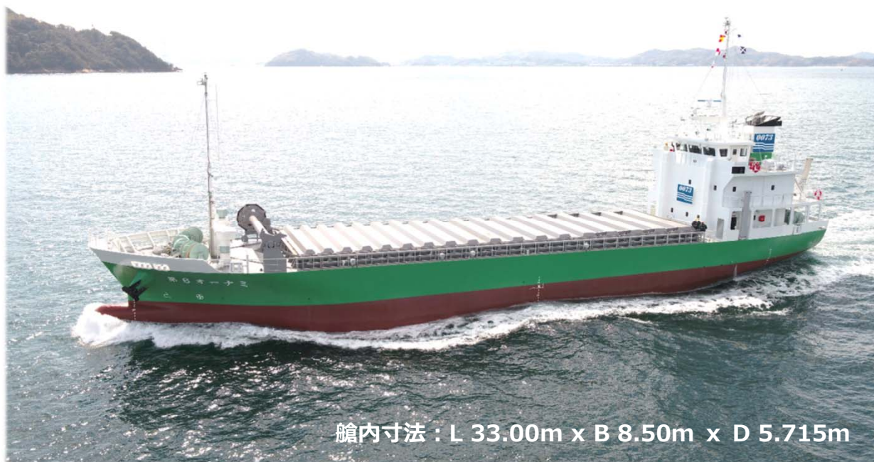
艙内寸法：L 33.00m x B 8.50m x D 5.715m

当社では、「第6オーナミ」を含む自社船（裏面参照）のほか専属船を保有しており、物流のプロフェッショナルとしてお客様のさまざまなニーズにお応えし、貨物を安全・確実に輸送いたします。何卒ご用命の程お願い申し上げます。